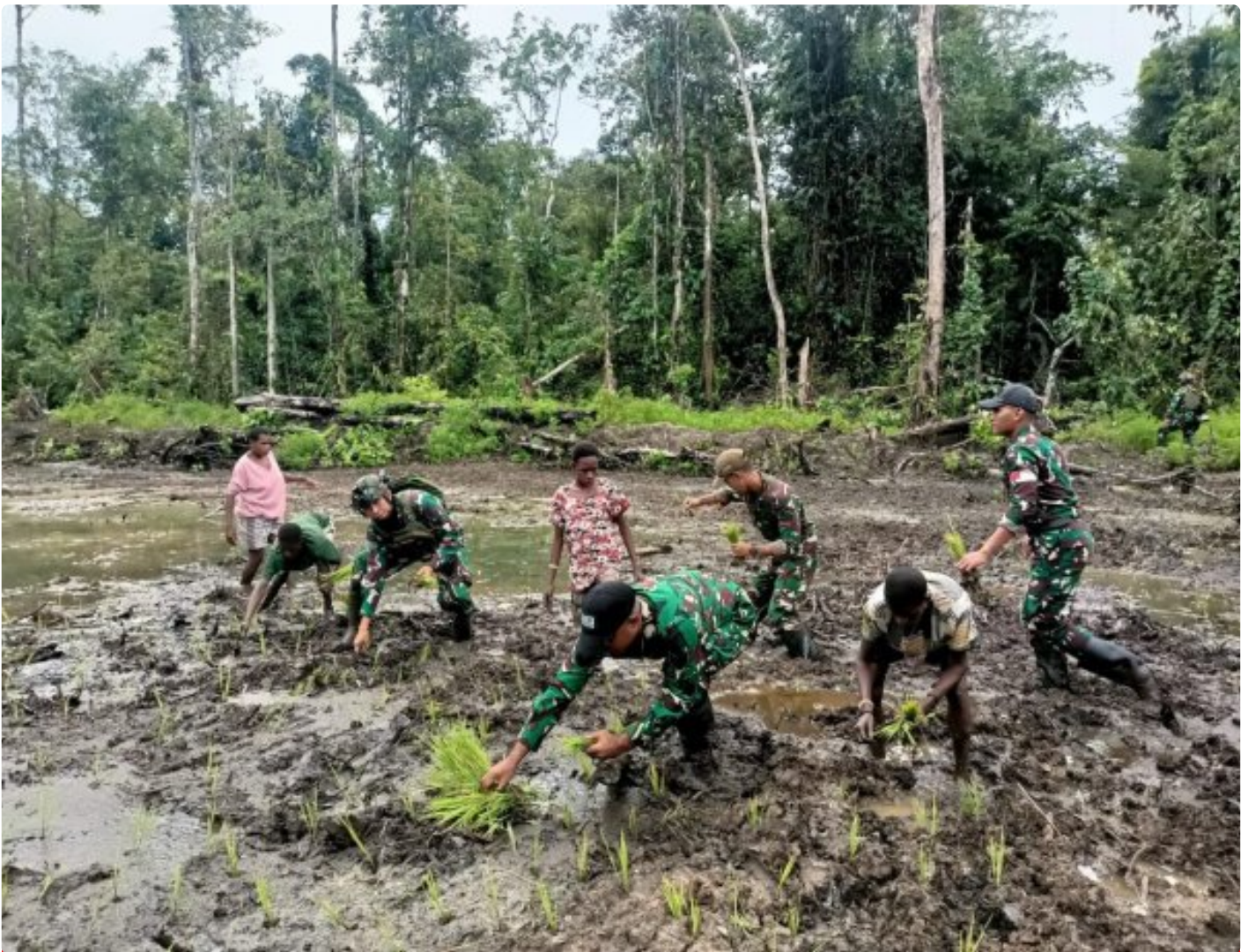
Foto: Satgas Pamtas Mobile RI-PNG Yonif 503/Mayangkara menggagas program ketahanan pangan yang melibatkan langsung warga Kampung Mumugu, Distrik Krepkuri, Kabupaten Nduga, Selasa (07/01/2025).